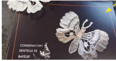
© Conservatoire de la Dentelle de Bayeux

X Places limitées — réservation conseillée